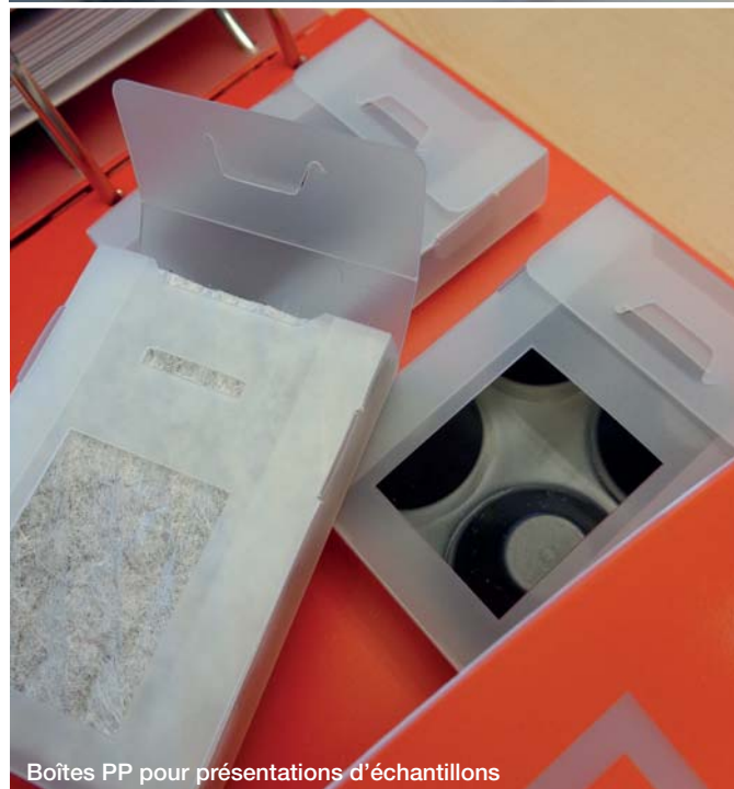
Boîtes PP pour présentations d'échantillons