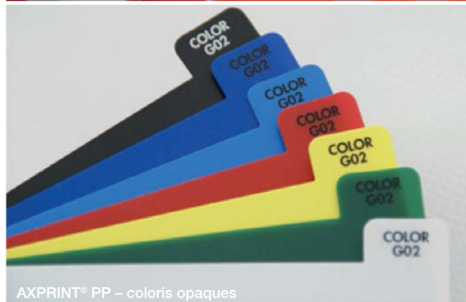
AXPRINT® PP – coloris opaques

Les feuilles AXPRINT® PP sont proposées sur stock en différents coloris, épaisseurs et formats et se prêtent idéalement à diverses utilisations :