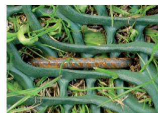
Fixation avec agrafes en U