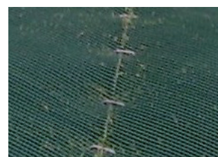
Rouleaux juxtaposés et reliés avec des agrafes en U