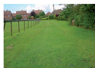
Après la pose de la natte, l'herbe pousse rapidement à travers les mailles