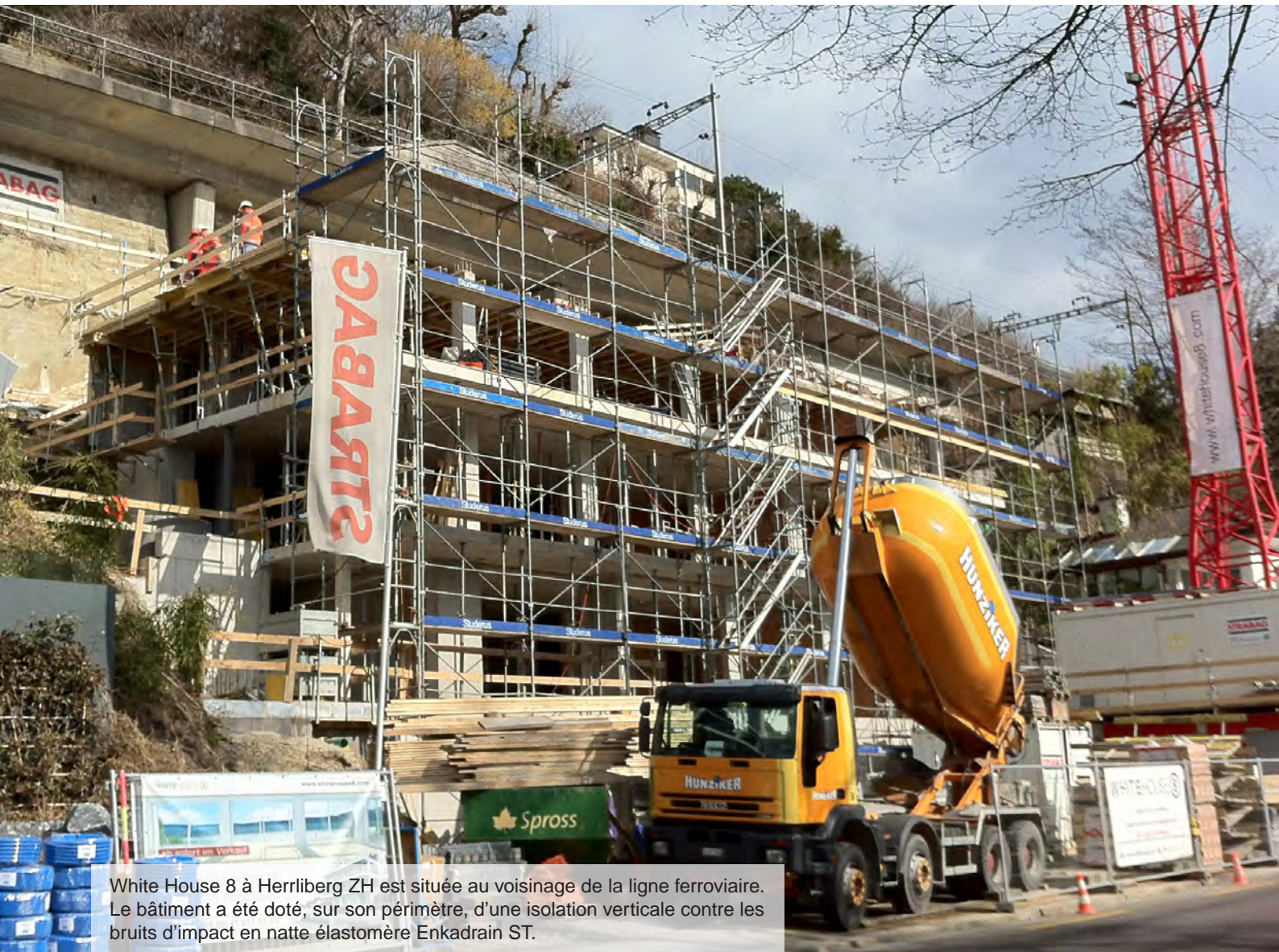
White House 8 à Herrliberg ZH est située au voisinage de la ligne ferroviaire. Le bâtiment a été doté, sur son périmètre, d'une isolation verticale contre les bruits d'impact en natte élastomère Enkadrain ST.